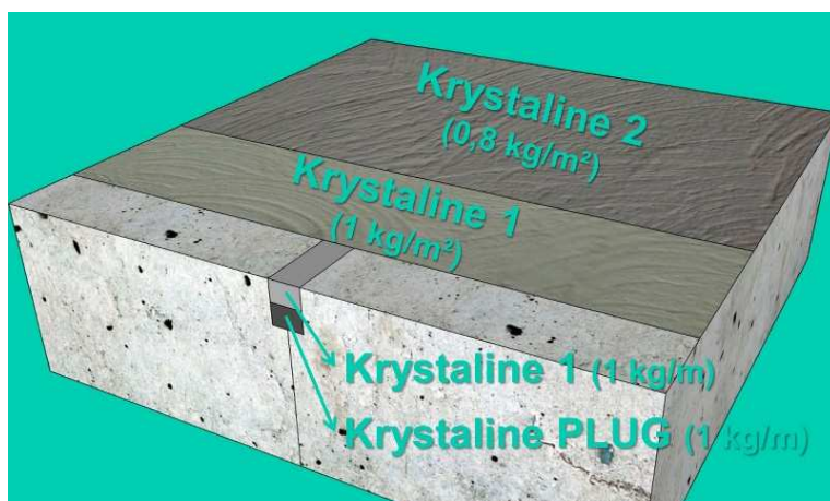
Rys.1. Przykładowy układ warstw oraz dobór materiałów KRYSTALINE w zależności od planowanego zastosowania.