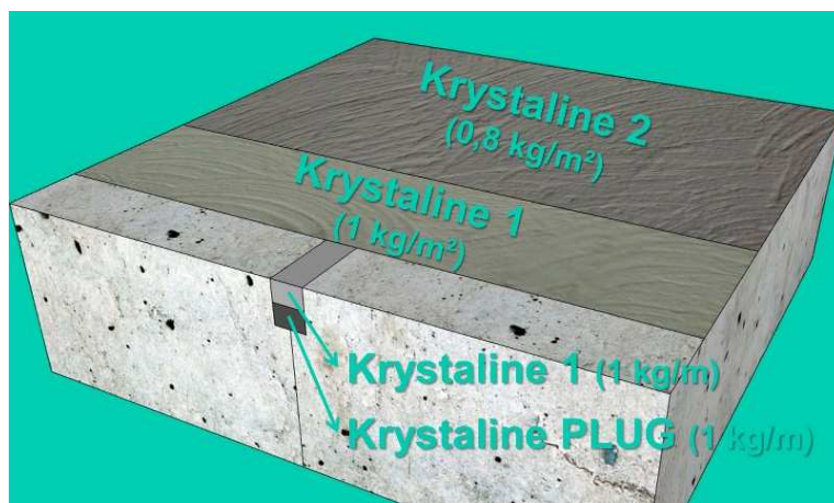
Rys. 1. Przykładowy układ warstw oraz dobór materiałów KRYSTALINE w zależności od planowanego zastosowania.