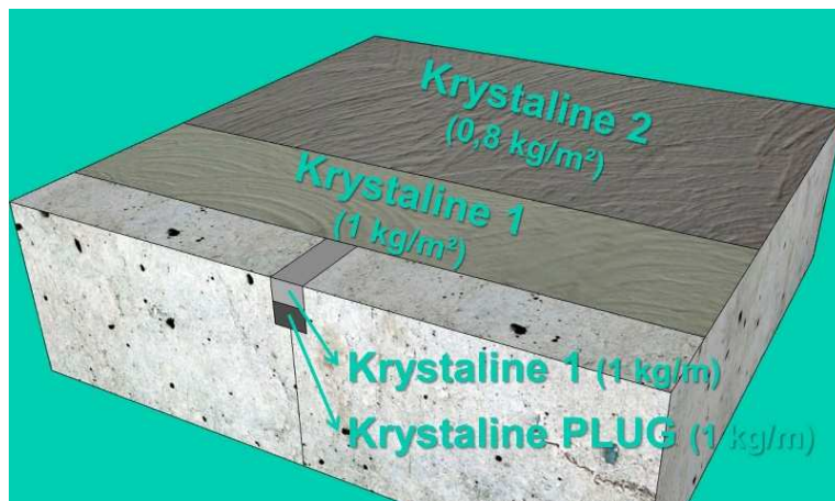
Rys. 1. Przykładowy układ warstw oraz dobór materiałów KRYSTALINE w zależności od planowanego zastosowania.